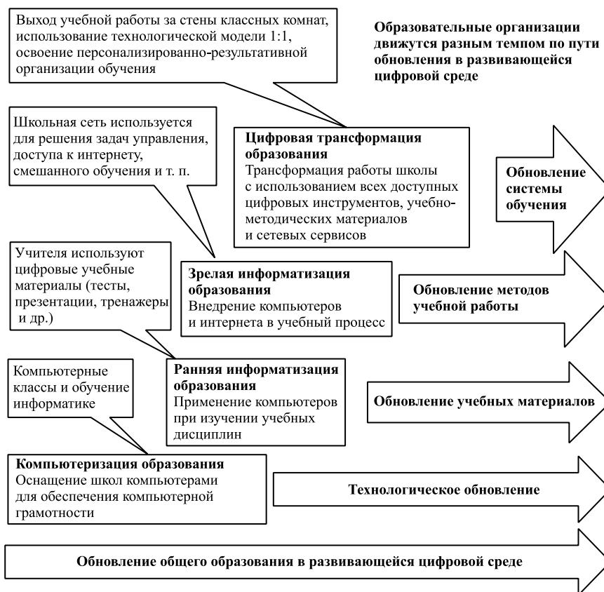
Рис. 2. Компьютеризация, ранняя информатизация, зрелая информатизация, цифровая трансформация — этапы обновления общего образования в развивающейся цифровой среде

Преобразования, наблюдавшиеся в инновационных школах, которые достигли 3-го этапа, дали основание в начале 2000-х гг. выделить намечающийся в то время 4-й этап, который был назван этапом цифровой трансформации образования [Уваров, 2002]. На рис. 2 приведено сравнительное описание четырех выделенных этапов: компьютеризация, ранняя информатизация, зрелая информатизация и цифровая трансформация